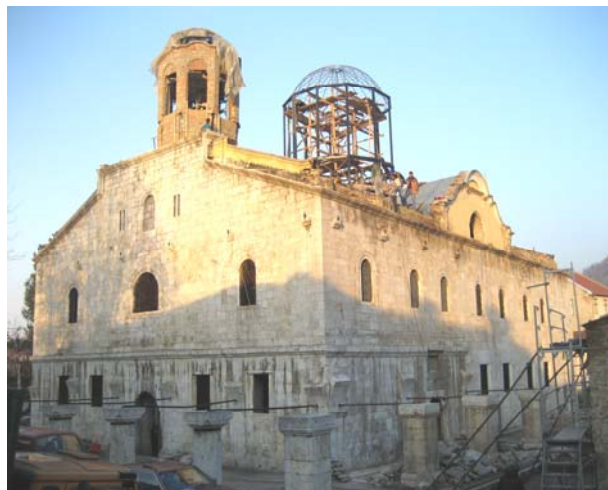
Садашњи изглед храма. Потпуно је завршена кровна конструкција и завршавају се радови на централној куполи и звонику.