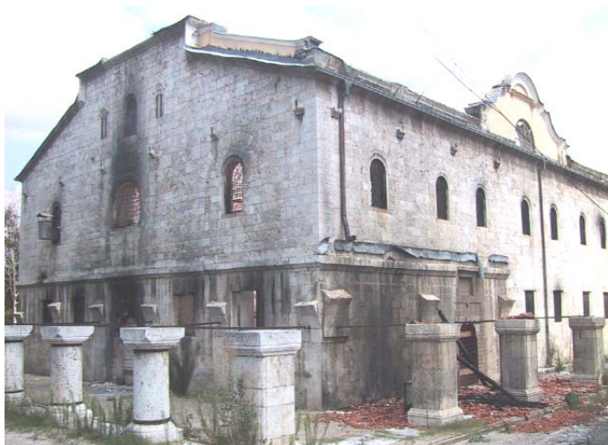
Изглед храма пре почетка радова на обнови