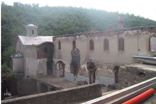
Изглед сестринског конака пре уклањања рушевина