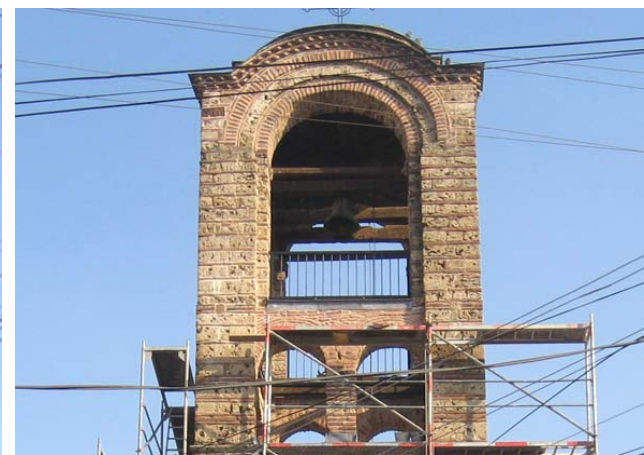
Изглед звоника након завршене реконструкције и консолидације

У току наредне године предвиђена је опсежна санација живописа у сарадњи домаћих српских експерата и страних експерата из Грчке и Италије.