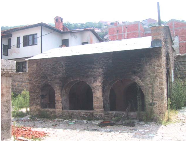
Изглед цркве пре почетка радова