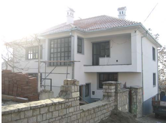
Садашњи изглед парохијског дома

У току наредне, 2007. године предвиђено је унутрашње уређење ових објеката.