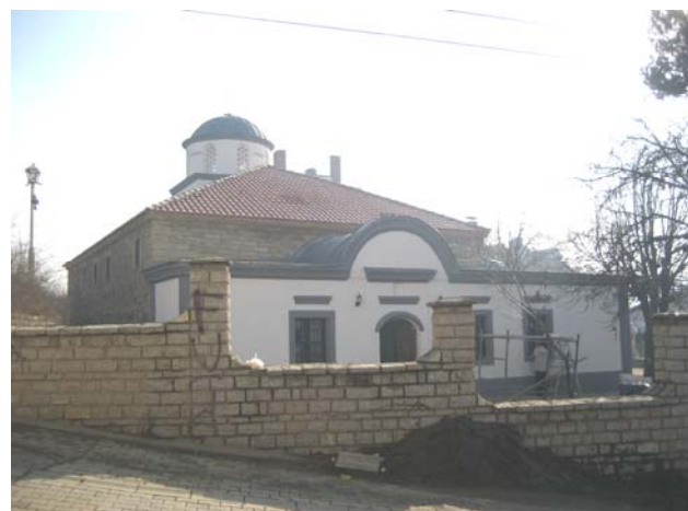
Спољашњи изглед храма након завршетка обнове

У току наредне 2007. године предвиђено је детаљно унутрашње уређење храма са постављањем новог иконостаса и санацијом делова сачуваних фресака на бочним зидовима.