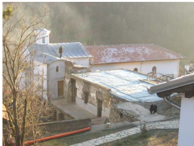
Садашњи изглед након консолидације зграде и изливања плоче над првим спратом конака

У току наредне, 2007. године предвиђена је потпуна реконструкција сестринског конака. Тиме ће манастир Девич добити још један обновљени конак са санираном црквом и зимском капелом.