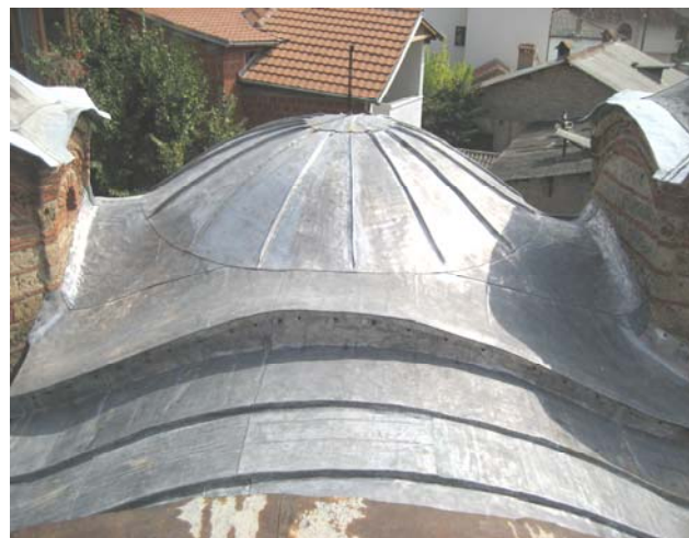
Изглед крова након покривања новим оловним покривачем у лето 2006. год