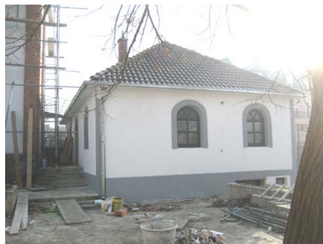
Садашњи изглед крстионице