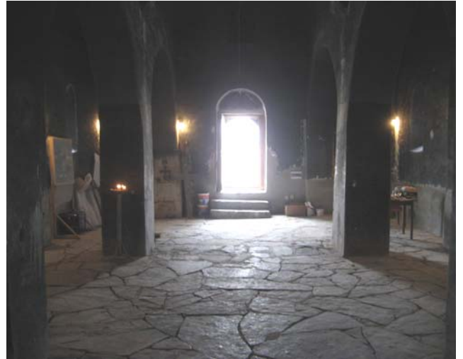
Садашњи изглед унутрашњости храма