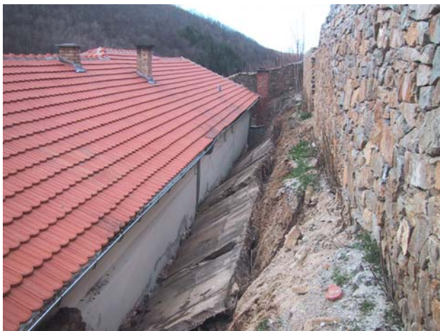
Потпорни зид пре санације (наслоњен на трпезарију)