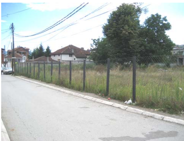
Изглед локације пре обнове оградног зида

Потпуна обнова храма Пресвете Богородице и парохијског дома који су уништени у марту 2004. године предвиђена је за 2007. годину.