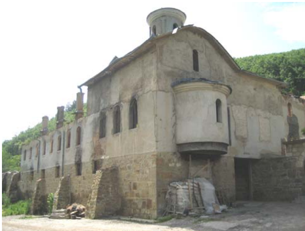
Изглед гостинског конака и зимске капеле пре обнове