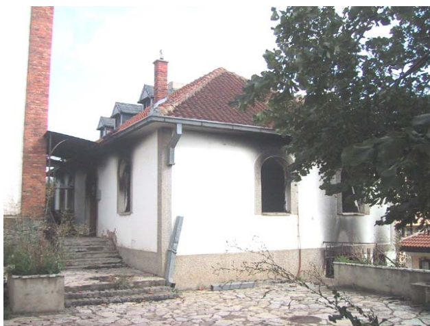
Спољашњи изглед крстионице пре обнове