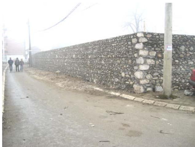
Садашњи изглед недовршеног каменог зида

Манастир Високи Дечани 24. децембар 2006. год.