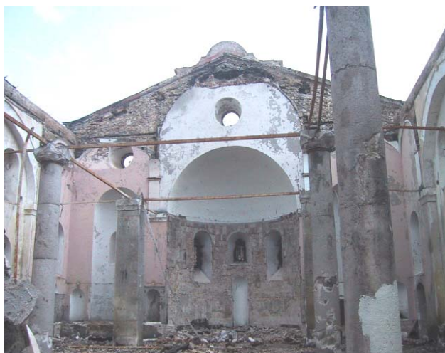
Изглед унутрашњости храма пре почетка процеса обнове