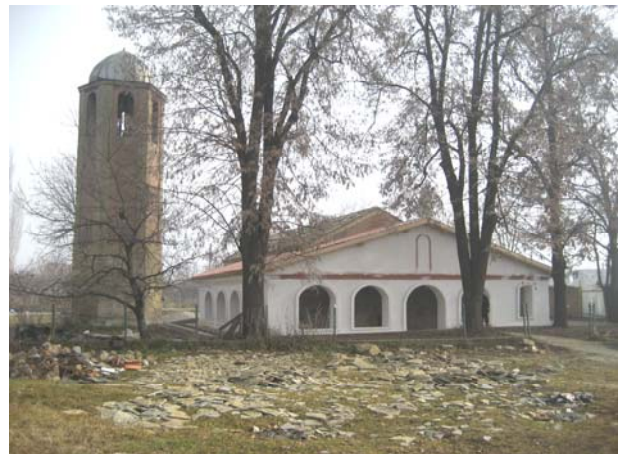
Садашњи изглед цркве