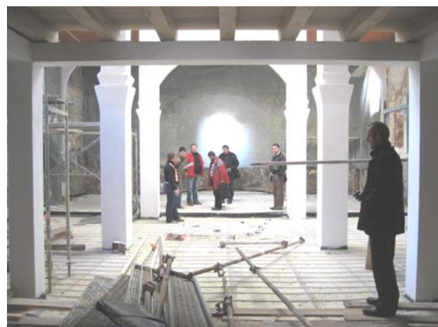
Унутрашњи изглед храма након завршетка грубих грађевинских радова