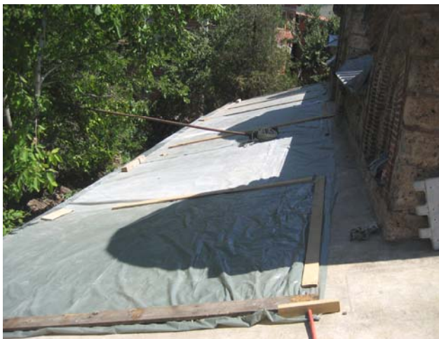
Изглед дела крова са кога је украден оловни покривач. Кров је био привремено заштићен најлонским покривачима крајем 2005. год.