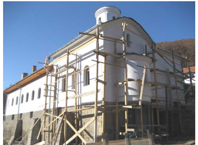
Садашњи гостинског конака и зимске капеле