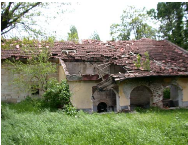
Изглед бочног дела храма са припратом пре обнове