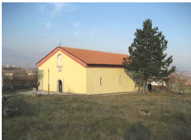
Садашњи изглед храма