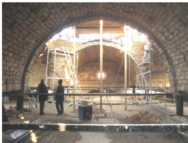
Изглед поткровног дела цркве испод централне куполе. Сводови и пандантифи урађени су од камена сиге

У току наредне године предвиђено је да се заврши унутрашње уређење храма са постављањем новог иконостаса.