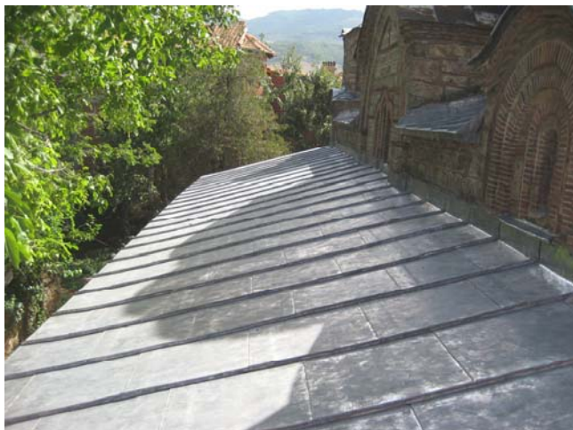
Изглед крова након покривања новим оловним покривачем у лето 2006. год