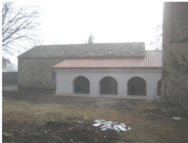
Садашњи изглед бочног дела храма са припратом