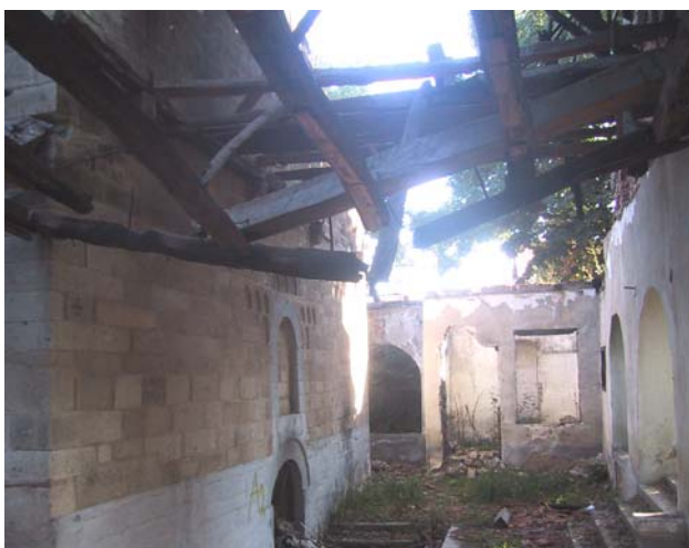
Изглед припрате храма пре почетка радова