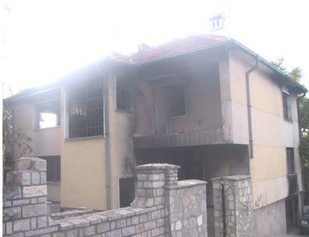
Изглед парохијског дома пре обнове