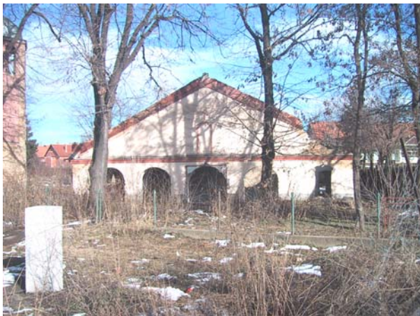
Изглед цркве пре почетка радова