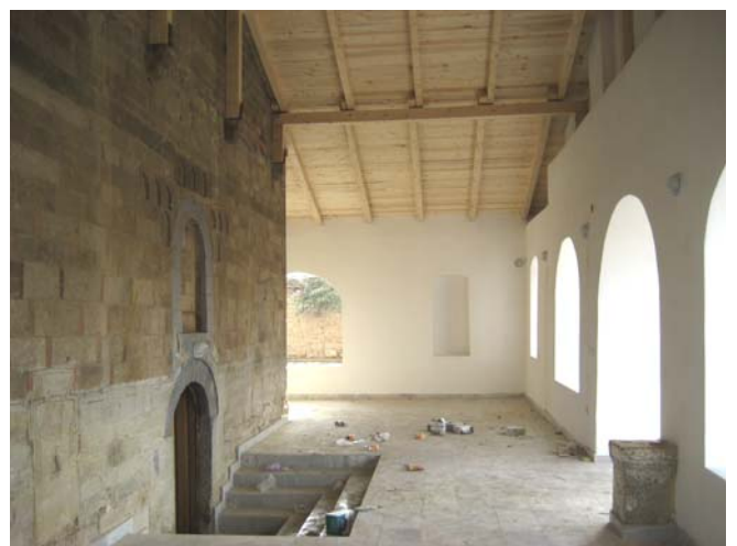
Изглед припрате при крају радова на обнови