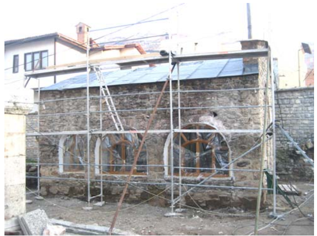
Садашњи изглед цркве