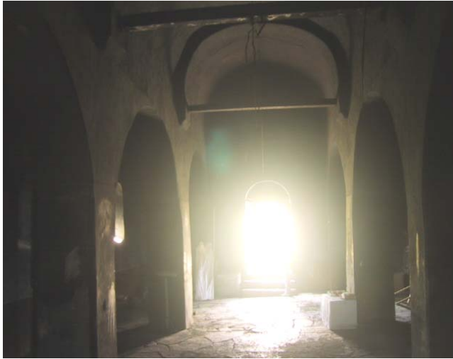
Изглед унутрашњости храма пре почетка радова