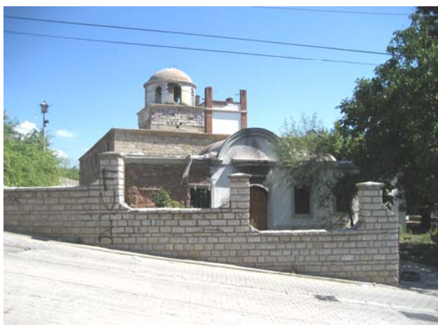
Спољашњи изглед храма пре почетка обнове