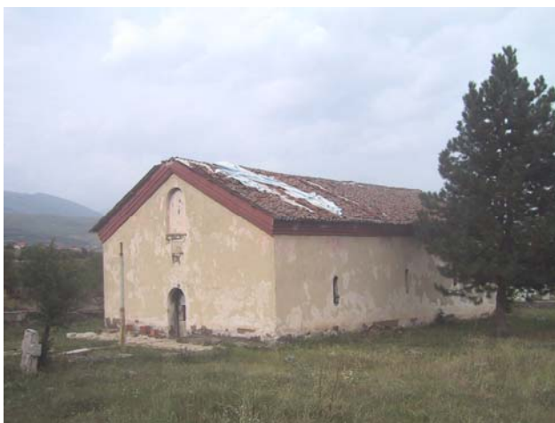
Изглед храма пре почетка радова на обнови

У току следеће године предвиђена је санација живописа и унутрашње уређење цркве са постављањем новог иконостаса.