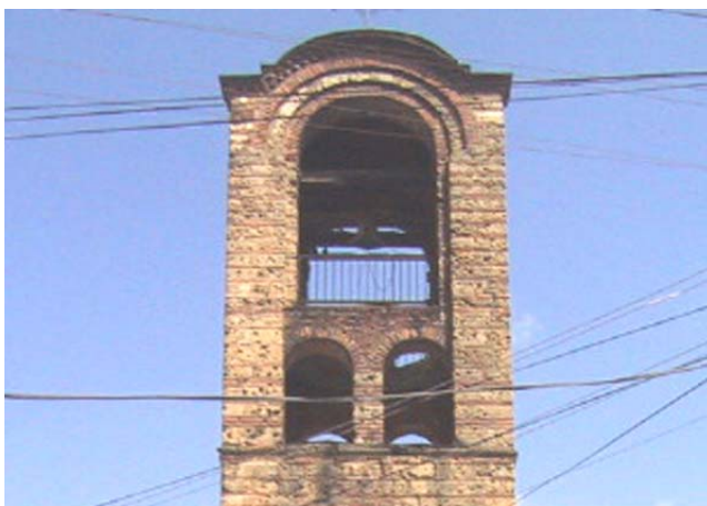
Изглед горњег дела звоника пре реконструкције и консолидације