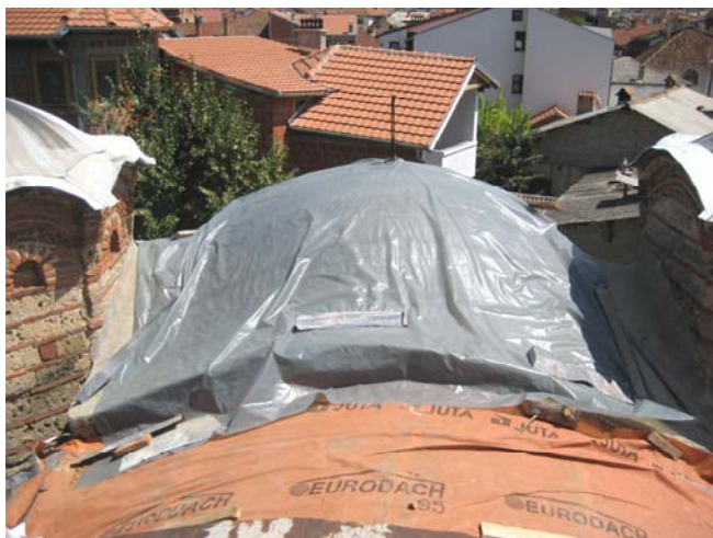
Изглед дела крова са кога је украден оловни покривач. Кров је био привремено заштићен најлонским покривачима крајем 2005. год.