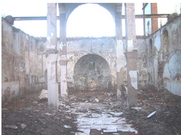
Унутрашњи изглед храма пре обнове

У току наредне 2007. године предвиђено је детаљно унутрашње уређење храма са постављањем новог иконостаса и санацијом делова сачуваних фресака на бочним зидовима.