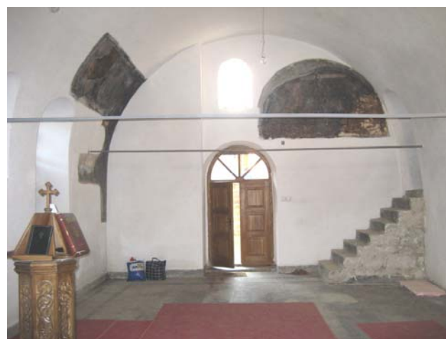
Садашњи изглед унутрашњости храма

За наредну 2007. годину предвиђена је санација живописа и израда новог иконостаса.