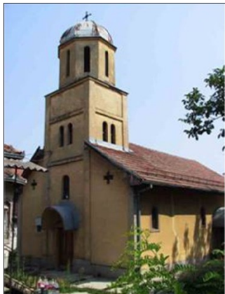
Crkva pre uništenja

Crkva Uspenja Presvete Bogorodice je potpuno uništena marta 2004, uklonjen je otpad sa gradilišta. Nema bitnih ostataka.