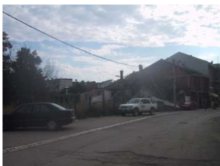
Početno stanje. Privremena ograda