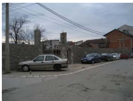
Zid tokom obnove