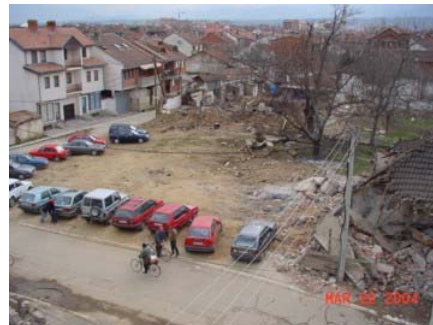
Gradilište posle marta 2004

Obnova obimnog zida crkve je odobrena kao prvi korak dalje obnove